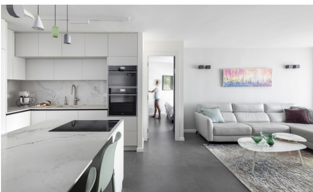
עיצוב נטעלי נוי