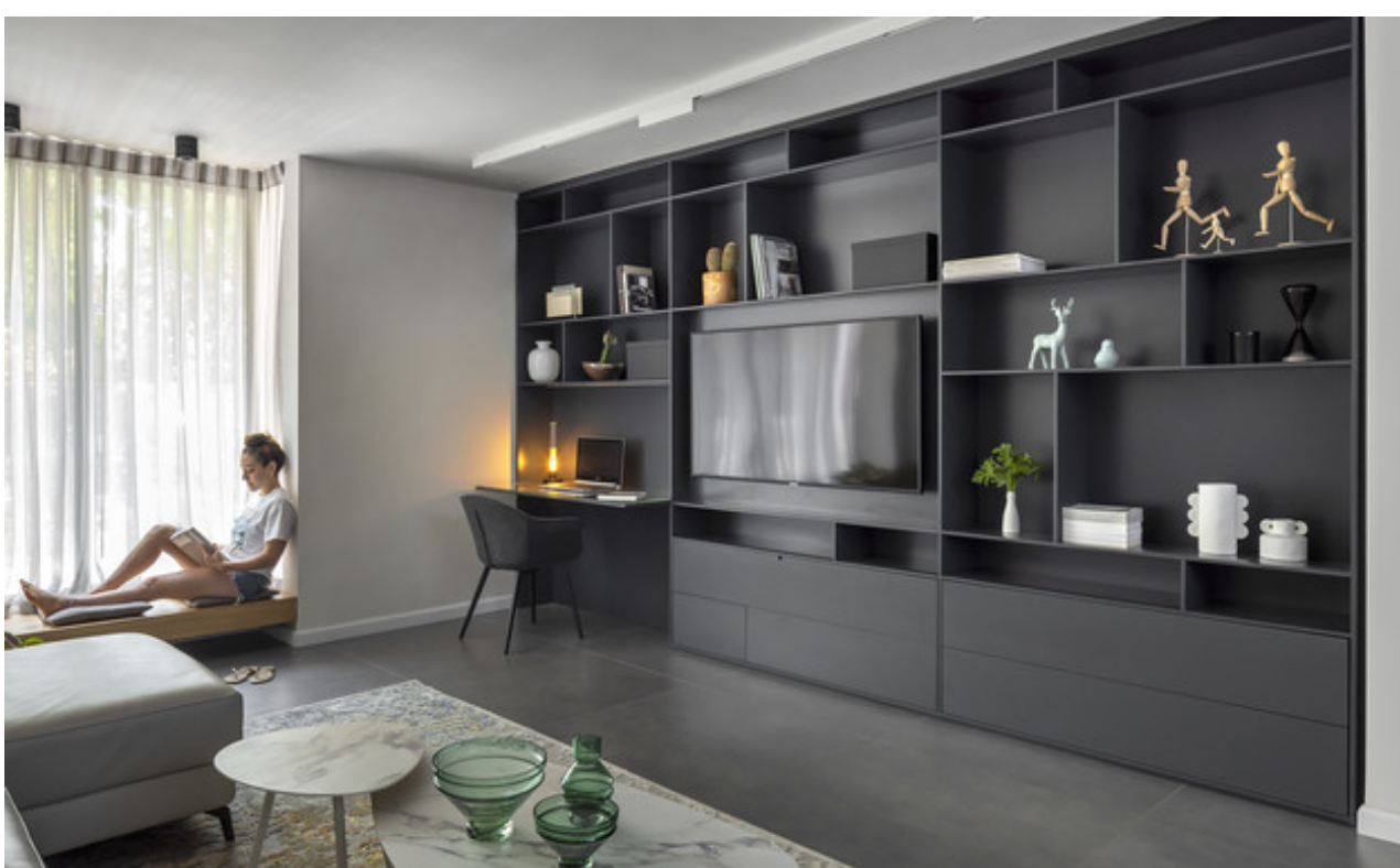
עיצוב נטעלי נוי

הדירה המשופצת כוללת מטבח עם אי עבודה גדול, קליניקה ושני חדרי שינה המאורגנים באלגנטיות בתוכנית הבניין האלכסונית והמאתגרת. הקירות האלכסוניים נוצלו לאחסון והם מוסוים בעזרת ארונות עץ שתוכננו במיוחד, ובמרפסת הותקנה במה מרחפת המשקיפה אל הגינה.