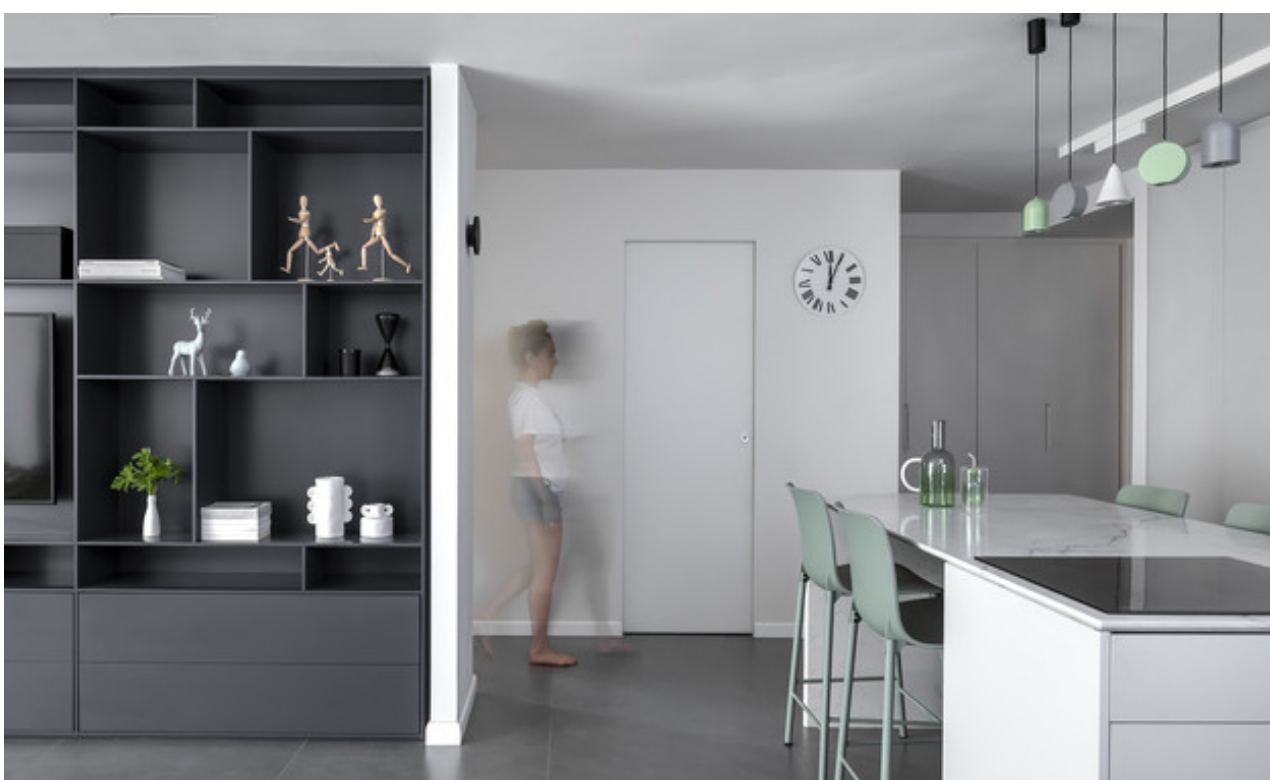
עיצוב נטעלי נוי