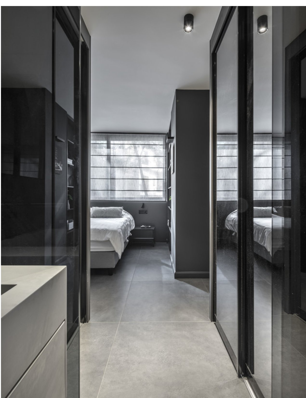
עיצוב נטעלי נוי