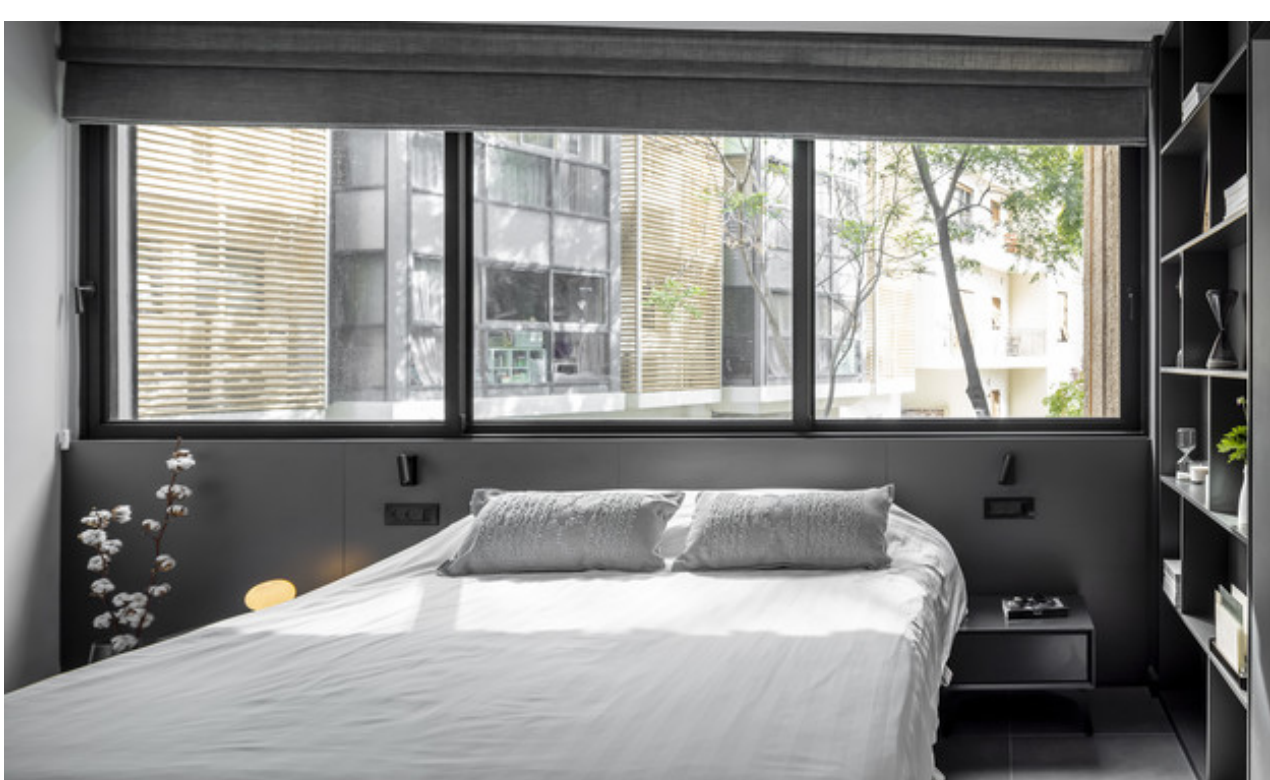
עיצוב נטעלי נוי