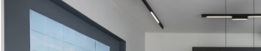
תמונת הפיקסלים נבחרה עוד לפני תחילת השיפוץ והצבעים בבית התואמה לה. המטבח

אף על פי שהחלוקה הפנימית של הבית השתנתה לחלוטין, לנוי היה חשוב לשמור על המרפסת החיצונית הקיימת, ולייצר חדר שינה נוסף מבלי לבטל או לסגור אותן, מתוך מחשבה על העתיד. לשם כך היה צורך להרוס ולבנות מחדש את כל הבית. אזור ההול שהיה בכניסה בוטל, והמטבח הוזז לאזור מרחב האירוח.